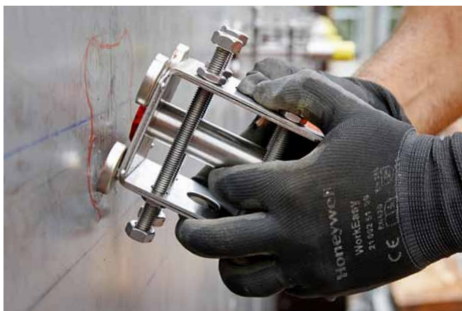
Montage ultra simple: la position exacte de l'armature est tracée sur le coffrage en acier propre.