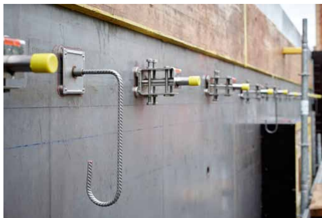
Ceci garantit un solide maintien de l'armature même pendant le coulage du béton.

A noter: les aimants peuvent influencer sur le fonctionnement des stimulateurs cardiaques ou des défibrillateurs. Par conséquent il faut maintenir une distance suffisante (>25 cm) par rapport aux corps aimantés.