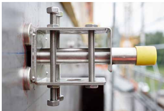
Les aimants tirent l'armature contre le coffrage avec un couple de 1,2 kN et fixent celle-ci. Il est recommandé de maintenir en plus la gaine dans sa position avec un acier d'armature avant de couler le béton.

F.J. Aschwanden SA Grenzstrasse 24 CH-3250 Lyss Switzerland T +41 (0)32 387 95 95 F +41 (0)32 387 95 99 info@aschwanden.com www.aschwanden.com