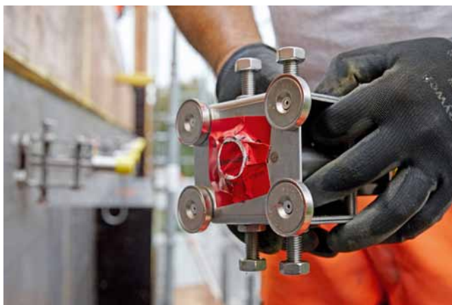
Les éléments d'armature ARBO, CRET et RIBA sont équipés chacun de quatre aimants puissants.

Les coffrages en acier sont de plus en plus souvent utilisés sur les chantiers. Aschwanden a développé une solution économique (brevet européen EP déposé) permettant là aussi de monter de manière simple, rapide et fiable les éléments des gammes de produits ARBO, CRET et RIBA: grâce à des aimants spéciaux qui restent dans le béton une fois celui-ci coulé et qu'il n'est pas nécessaire d'enlever moyennant des opérations longues et fastidieuses.